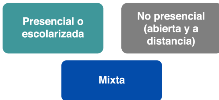
Figura 1. Modalidades educativas Elaborado a partir de Barroso (2006, p. 6).

Básicamente, las modalidades educativas se dividen en 3, como se muestra en la Figura 1 .